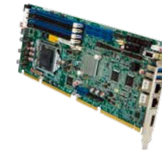
Karten und Backplanes

Unsere CPU Boards sind im Gegensatz zu herkömmlichen Consumer-Mainboards für den Einsatz im industriellen Umfeld konzipiert. Themen wie Dauerbetrieb, erweiterter Temperaturbereich, Vibrationsbeständigkeit und Langzeitverfügbarkeit sind für uns bekannte Größen. Hinzu kommen noch die technischen Besonderheiten, die für einzelne Applikationen notwendig sind. Somit entspricht kein Board dem anderen, jedes zeichnet sich durch ganz individuelle Spezifikationen und ein eigenes Design aus.